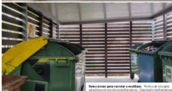
Seleccionar para reciclar o reutilizar. Puntos de recogida selectiva en la provincia de Barcelona - Diputación de Barcelona.

centenar de municipios barceloneses que han participado en los círculos de comparación las cifras son un poco más bajas, con 1,22 kilos por habitante y día.