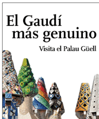
Bàner Palau Güell 250x300 Castellà