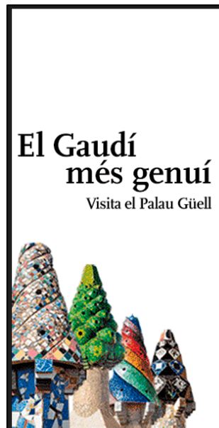
Bàner Palau Güell 300x600 Català