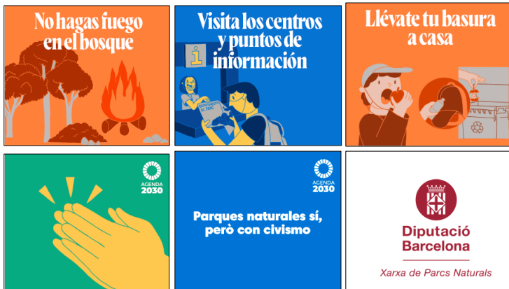
Civisme als Parcs 300x250 Castellà