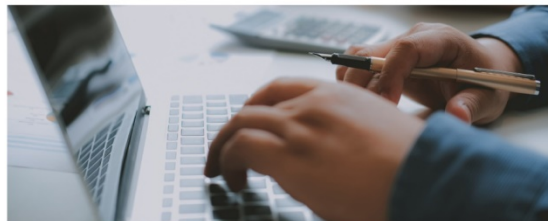
L'Administració pública necessita perfils professionals qualificats per afrontar la transformació que viu en la seva activitat professional.

La Diputació treballa perquè els joves percebin l'Administració local com una sortida professional