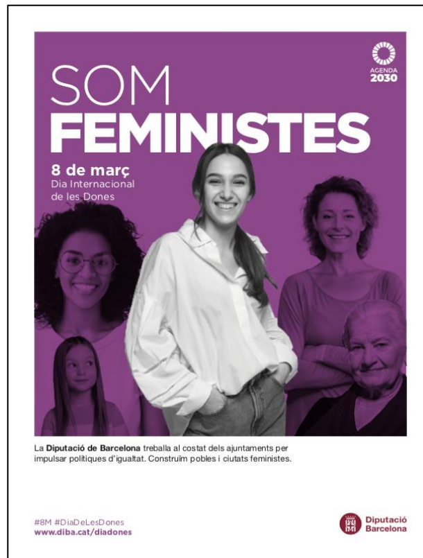
L'Opinió de L'Hospitalet 195x265 mm