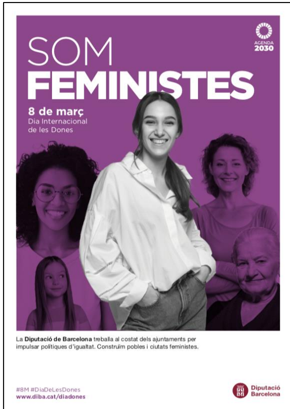
Cartell genèric. A3.