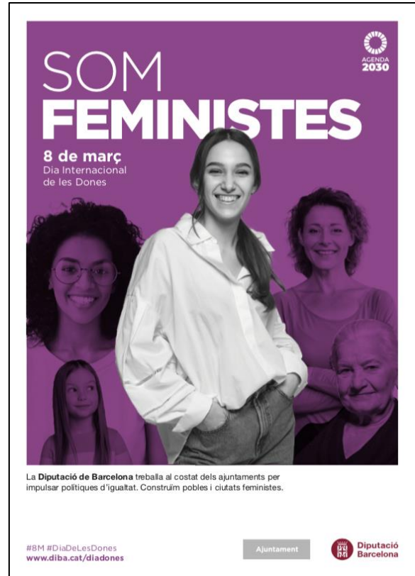
Cartell ajuntament. A3.