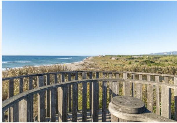
↑ Dalt, turisme sostenible de sol i platja al Delta del Llobregat.

El principal afluent del riu Llobregat, l'Anoia i el Cardener, també seran Vies Blaves. La Via Blava Cardener seguirà més de 50 quilòmetres de recorregut dins de la província de Barcelona, per la comarca del Bages, i la Via Blava Anoia seguirà els 65 quilòmetres del riu per les comarques de l'Anoia, l'Alt Penedès i el Baix Llobregat. La primera fase de la Via Blava Anoia, que uneix Jorba amb La Pobla de Claramunt passant per Santa Margarida de Montbui, Igualada i Vila Nova del Camí, ja està en execució i estarà disponible el primer trimestre de 2025, gràcies al suport dels fons europeus Next Generation UE. Es preveu que el conjunt del projecte Vies Blaves Barcelona estigui totalment enllestit a finals de 2035 i passarà per 59 municipis que sumen més d'un milió d'habitants. S'estima que en el cinquè any d'ús de les Vies Blaves hi haurà un total de 14.000 usuaris en dia punta i, en 10 anys els usuaris poden arribar a 26.000 en dia punta. Es calcula que aquest projecte tindrà un potencial econòmic de 18 milions d'euros. A més d'un gran patrimoni cultural, les Vies Blaves Barcelona recorreran 3 parcs naturals, 12 espais naturals protegits i 8 espais turístics amb més de 5.000 places d'allotjament disponibles entre hotels, pensions, allotjaments rurals, albergs i càmpings.